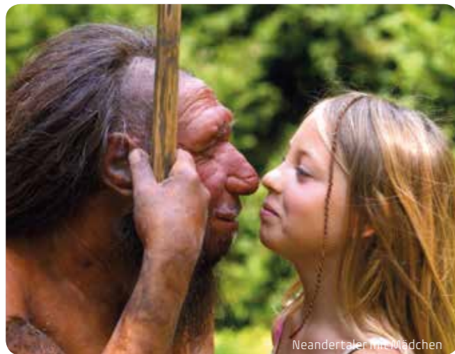
Neandertaler mit Mädchen

Mit seiner vielfältigen Vegetation und reichhaltigen Kulturlandschaft bietet das neanderland ein spannendes Naturerlebnis. Ein ausgedehntes Wanderwegenetz, zu dem der 240 km neanderland STEIG zählt, lockt Wanderer von Nah und Fern. Radwege mit Panoramaausblick durchziehen das neanderland und verbinden es mit seinen Nachbarregionen. Am Wegesrand liegen malerische Ortschaften mit typisch bergischer Architektur und historischen Stadtkernen, Museen, Sehenswürdigkeiten und urige Bauernhöfe. Zahlreiche Einkehrmöglichkeiten – vom traditionellen Gasthaus über Bauerncafés bis hin zum Gourmet-Restaurant – laden unterwegs zum Genießen und Verweilen ein.