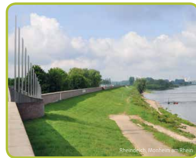
Rheindeich, Monheim am Rhein