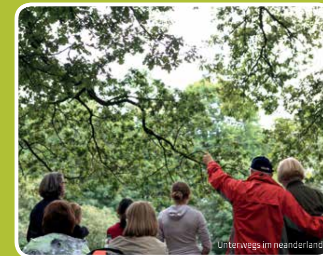
Unterwegs im neanderland