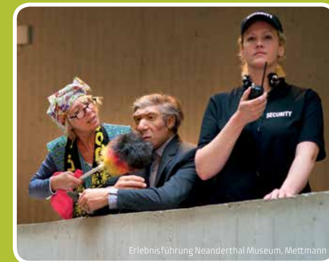
Erlebnissführung Neanderthal Museum, Mettmann