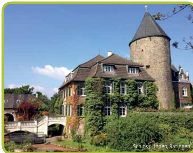
Schloss Linnep, Ratingen

Tel. 02104-992030 | info@neanderland.de | www.neanderland.de