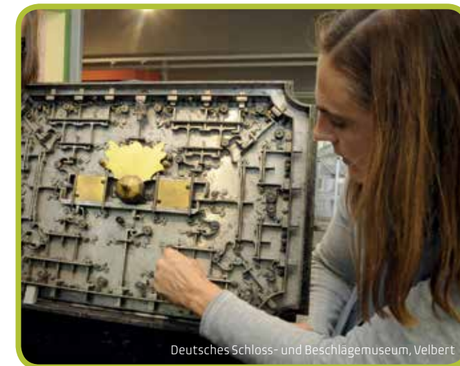
Deutsches Schloss- und Beschlägemuseum, Velbert