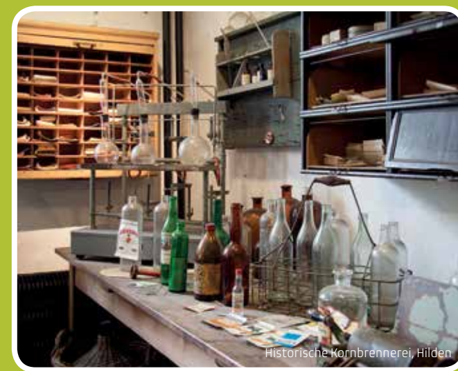
Historische Kornbrennerei, Hilden