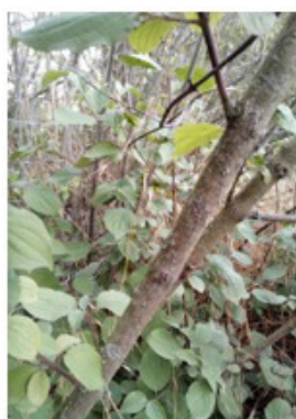
HARTRIEGEL = 70