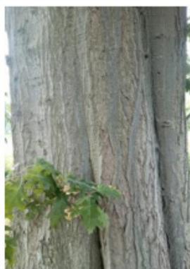
ROTEICHE = 17