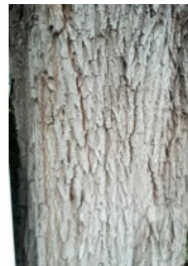
BRUCHWEIDE = 38