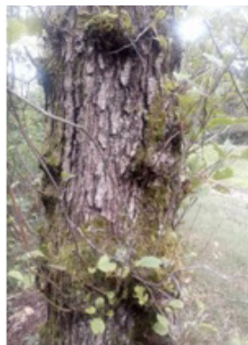
SCHWARZERLE = 80