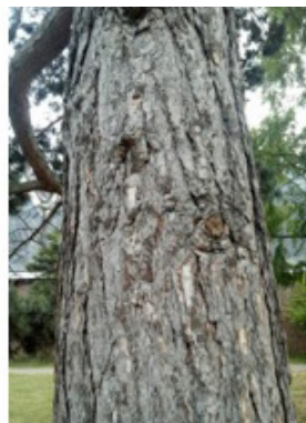
SCHWARZKIEFER = 52