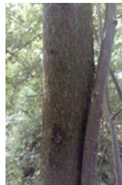
TRAUBENKIRSCH = 70