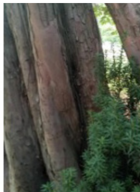
EIBE = 27