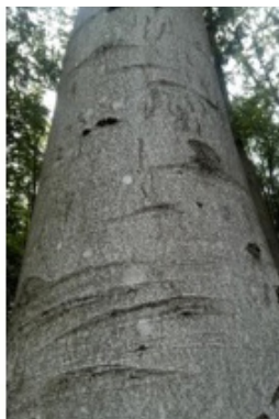
ROTBUCHE = 51