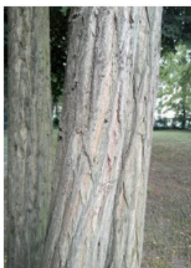
ROBINIE = 11