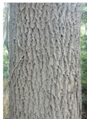
ESCHE = 80