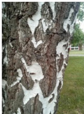
BIRKE = 97